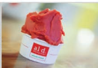
Gelato DI fragola